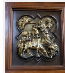
"Sacrificio di Isacco", Brunelleschi, 1401.

Il Rinascimento italiano si apre, secondo la storiografia del Ventesimo Secolo, con il concorso per la decorazione delle porte del Battistero di Firenze (1401) in occasione del quale assistiamo al poderoso scontro tra le concezioni estetiche proposte da Lorenzo Ghiberti e Filippo Brunelleschi. Il cardine ideologico del confronto consisteva nella maniera di avvicinarsi ai modelli dell'antichità classica greco-romana. Da una parte, quella di Ghiberti (il vincitore), si offriva una sapiente giustapposizione tra il mondo dell'antichità classica e il linguaggio del Gotico Internazionale, lo stile di moda in quel momento. Dall'altra, quella di Brunelleschi (il perdente) si evocavano direttamente e senza mediazione alcuna i modelli degli Antichi . Il risultato del concorso non deve ingannare, durante il Quattrocento